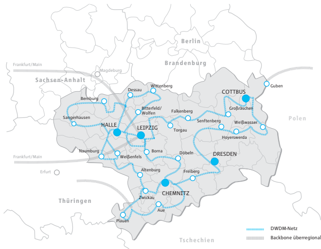
Netzgebiet envia TEL

envia TEL bietet als alternativer Telekommunikationsdienstleister besonders attraktive Konditionen bei den Sprach- und Datendiensten.